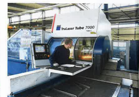
1 Auf einer Fläche von 30.000 m 2 vereint H. P. Kaysser mechanische Fertigung, vollautomatische Metallbearbeitung und Dienstleistungen rund um die Produkte. 2 Investitionen in moderne Produktionsanlagen gehören zur DNA von H. P. Kaysser. Mit einer Großinvestition in die Zukunft modernisiert das Unternehmen 2019 und 2020 seine Pulverbeschichtungsanlagen. 3 Laserteile4You: Was 2010 mit einer Pionierleistung und einem revolutionären Paukschlag in der Branche beginnt, hat sich zu einem leistungsfähigen Online-Bestellportal von H. P. Kaysser entwickelt. 4 Auch Rohrlaserbearbeitung gehört zum Fertigungsspektrum von H. P. Kaysser.